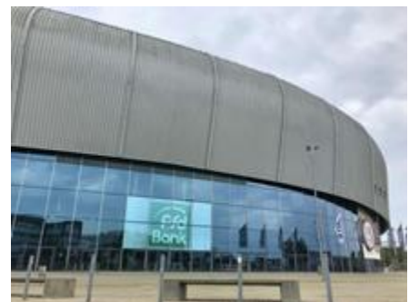
PSD BANK DOME in Düsseldorf-Rath